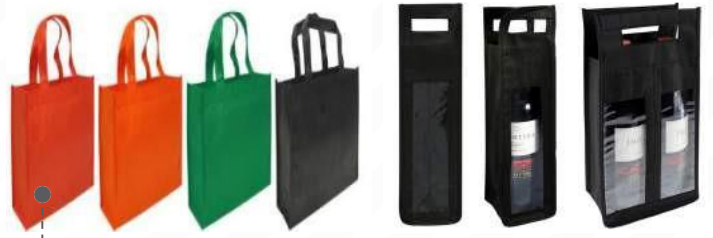
MORRALES, BOLSOS, BOLSAS ECOLÓGICAS BIODEGRADABLES