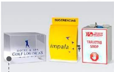
buzones de sugerencia