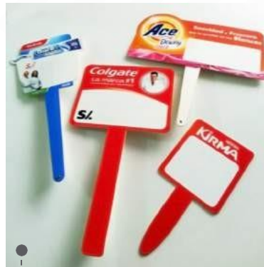
marcadores de precio