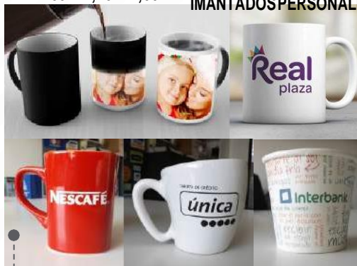
DISEÑOS PERSONALIZADOS / ERGONÓMICOS