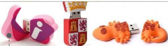
USB: DISEÑO, FABRICACIÓN DE MODELOS MARCAS