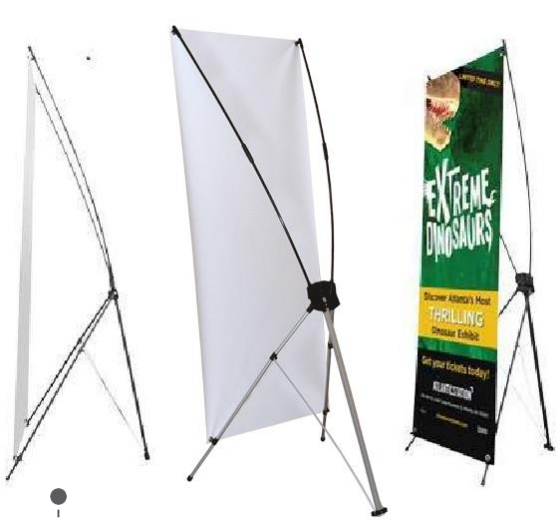
super eco xb-d (banner stand)

sistema de impresión digital 1400 dpi. tintas originales, displays / gigantografías: 11 o 13 onz. tubos listones de madera termo sellado a ambos lados / viniles laminados / instalaciones