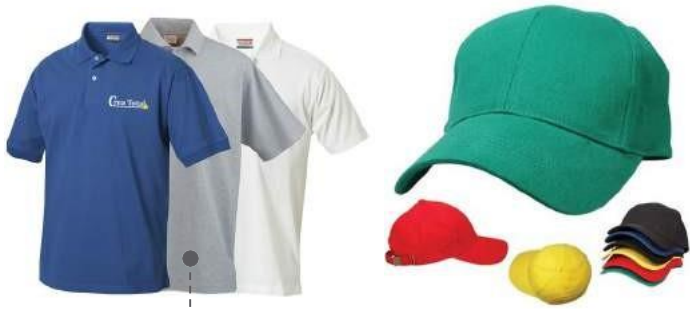
POLOS Y GORRAS BORDADOS EXCLUSIVOS