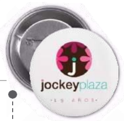
PINES, PRENEDORES LLAVEROS DESTAPADOR ESPEJO / IMÁN 55 MM, 75 MM, 90 MM