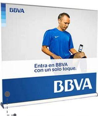
roll screen extra wide