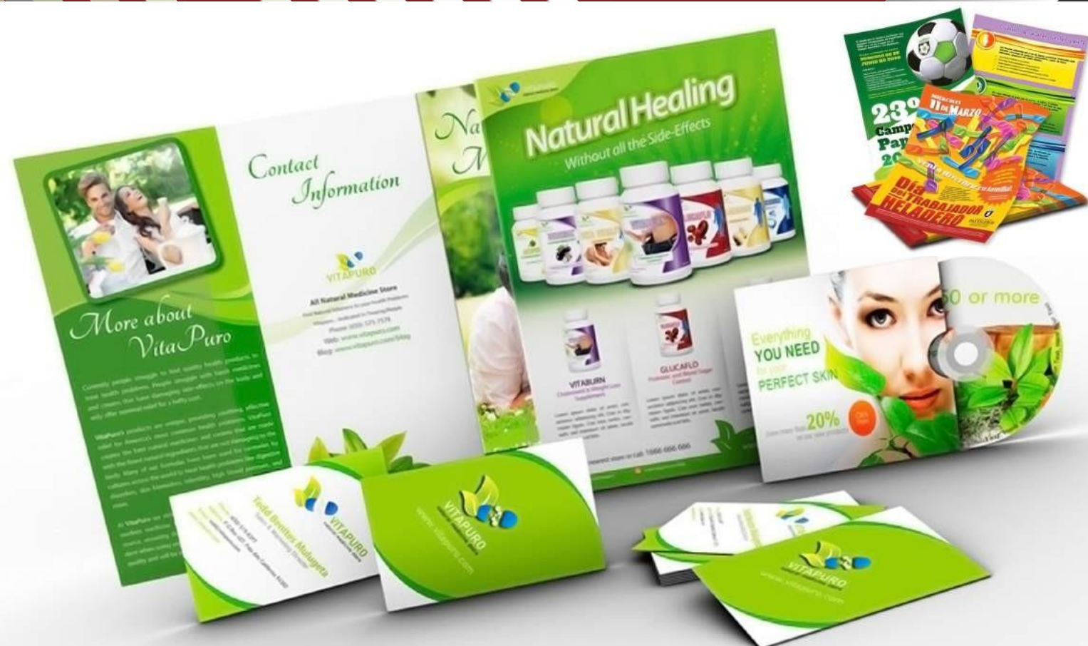
imagen corporativa - papelería díptico / trípticos / flyers / volantes afiches en papel - cartón colgantes de cartón jalavistas de cartón cajas de cartón agendas publicitarias carpetas publicitarias cuadernos corporativos piones / carpetas de cuero agendas anuales bolsas de papel stickers