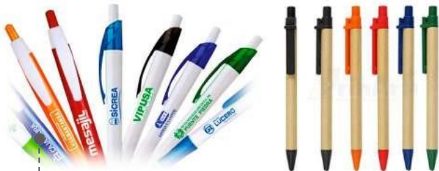
LAPICEROS: ECOLÓGICOS, METÁLICOS, PLÁSTICOS.