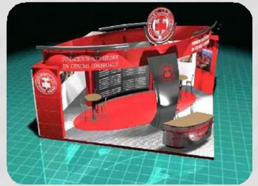
stands, puntos de ventas, góndolas

fabricamos todo tipo de creaciones con diseño digital, proyectos personalizados.