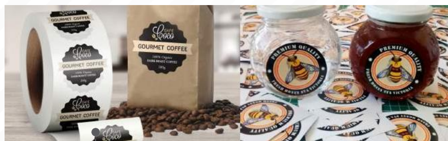
etiquetas papel / adhesivas de marcas