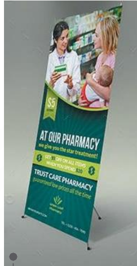
cxb4 banner stand