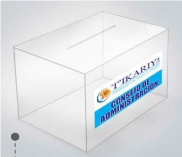
ánforas de mesa