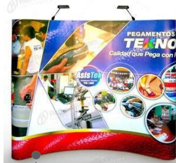
back board curvo