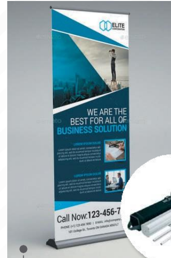
roll screen premium