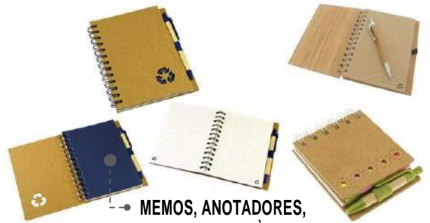
MEMOS, ANOTADORES, CUADERNOS ECOLÓGICOS