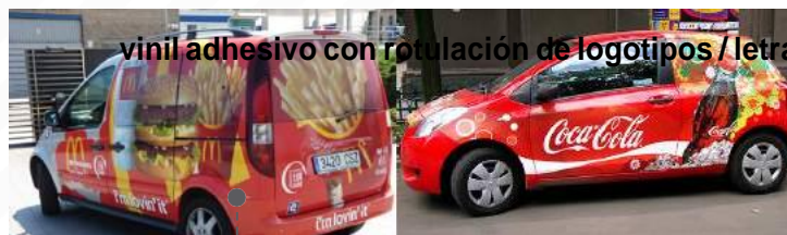
vinil adhesivo con rotulación de logotipos / letras