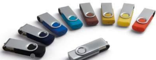
USB 4GB/8GB/16GB/32GB USB LLAVERO METÁLICO, USB LLAVE