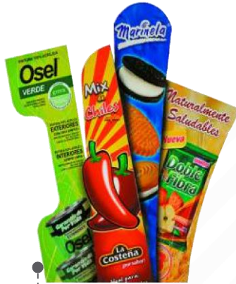
rompetráficos o stopper