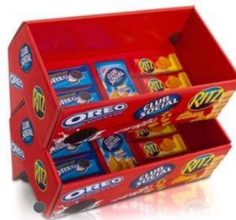
dispensador de mostrador