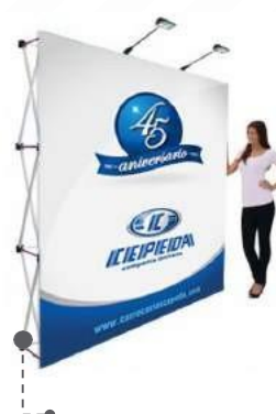
back board recto