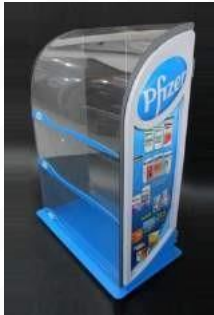
exhibidores de productos